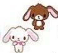
Shirousa & Kirousa