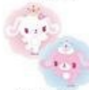
Balletusa & Primausa