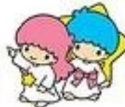
Kiki & Lala