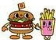
Dokidoki Yummy Chums